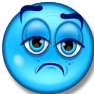
Hasta el Sur

ALL THE WAY SOUTH (Hasta el Sur) Modismo. El estado mental que se encuentra hasta el fondo; y en el que el individuo tiene que ser efecto total. Posiblemente no podría producir efectos de ninguna clase en nadie más. Se encuentra abajo de muerte.