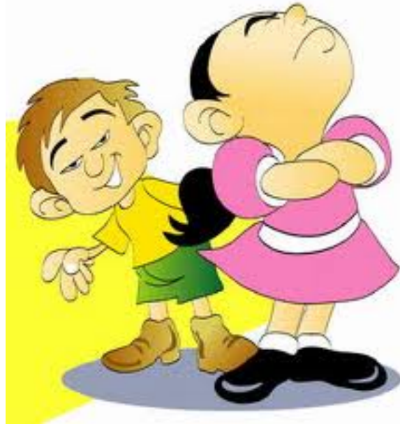
Ruptura de ARC

ARC BREAK ASSESSMENT (Determinación de Ruptura de ARC) 1. Leer al E-Meter una lista de ruptura de ARC apropiada para la actividad del pc y no hacer nada sino localizar e indicar las cargas encontradas diciéndole al pc lo que registró en la aguja. 2. No es auditación porque no usas el ciclo de comunicación de auditación. No acusas recibo (ack) a lo que dice el pc, tú no preguntas al pc qué cosa es. No te comunicas. Determinas la lista entre tu y el Mac-Meter, como si ahí no hubiera un pc. Entonces, encuentras lo que te da lectura y se lo dices al pc. Y eso es todo.