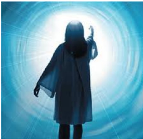
ÁREA ENTRE VIDAS

BETWEEN-LIVES ARFA: (Area de EntreVidas) 1. Las experiencias de un thetán durante el tiempo entre perder un cuerpo y tomar otro. (PXL, pág. 105) 2. En la muerte el ser theta deja el cuerpo y va al área de entre-vidas. Aquí "se reporta", se le da un fuerte implante para olvidar y luego es disparado a un cuerpo justamente antes de que nazca. Al menos ésa es la forma en que estaba operando el antiguo invasor en el área de la Tierra. (HOM, pág. 68)