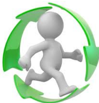
Ciclo de Acción

ACTION: (Acción) 1. Un movimiento a través del espacio que tiene cierta velocidad. (SH Spec, 42, 641OC13) 2. Acción = moción o movimiento = un acto = a una consideración de que el movimiento ha ocurrido. (FOT, pág. 19) 3. Doingness dirigido hacia Havingness, (Scn 8-8008. pág. 26) 4. La acción consiste de producciones de energía con flujos de entrada y de salida. Acción es intercambios de energía en un nivel denso de mest. (5203CM05A)